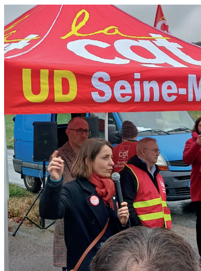
Le 19 février 2026 Rassemblement pour la réindustrialisation, de la Vallée du Cailly en présence de Sophie BINET, Secrétaire Générale de la CGT.