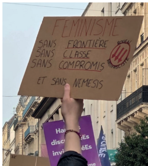
Le 8 mars, à Rouen