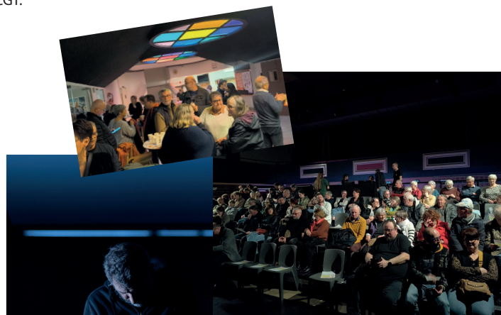
Le 13 mars, parce que la culture, c'est pour tout le monde ! Les UL de l'agglomération Rouennaise ont coproduit une pièce de théâtre d'après "À la ligne - Feuilles d'usine de Joseph Ponthus".