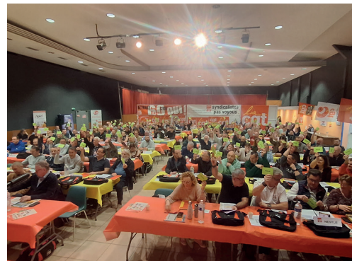
Congrès de l'UL de Dieppe - les 5 et 6 mars