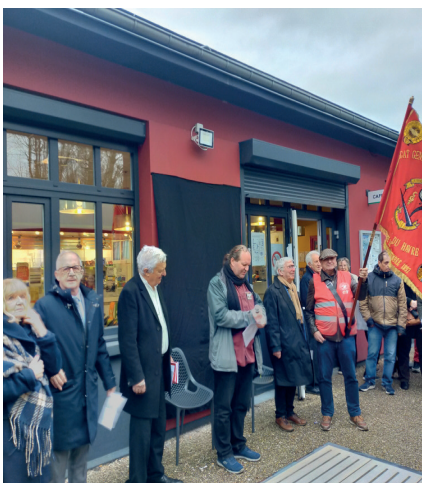
Le 20 février, initiative Jules Durand, au CHR à Sotteville - Discours et inauguration de la plaque commémorative.