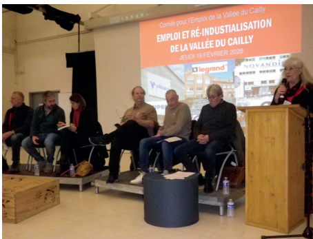
Le 19 février, débats sur la réindustrialisation de la Vallée du Cailly.