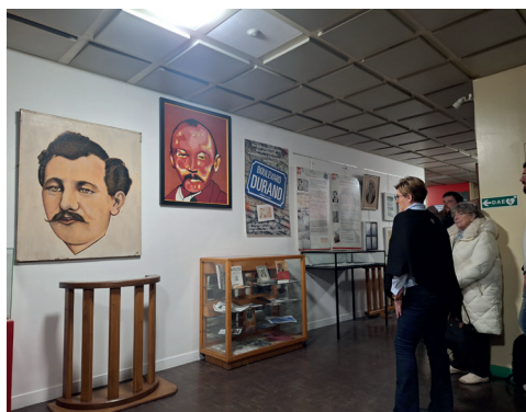
Le 20 février, initiative UL Le Havre sur les 100 ans de la mort de Jules Durand.