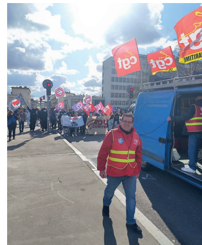
Le 21 mars 2026 - Manif contre le racisme à Rouen.